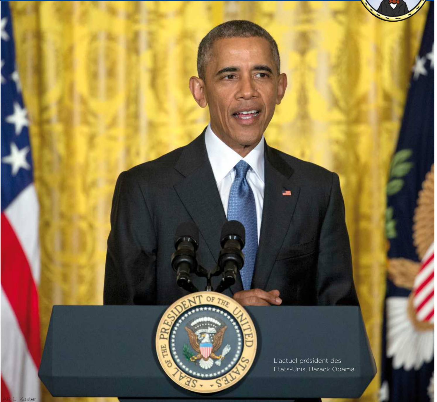
L'actuel président des États-Unis, Barack Obama.