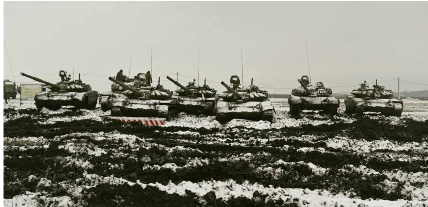
Des chars russes lors d'exercices de tir, le 12 janvier, dans la région de Rostov, à quelques dizaines de kilomètres de l'Ukraine.