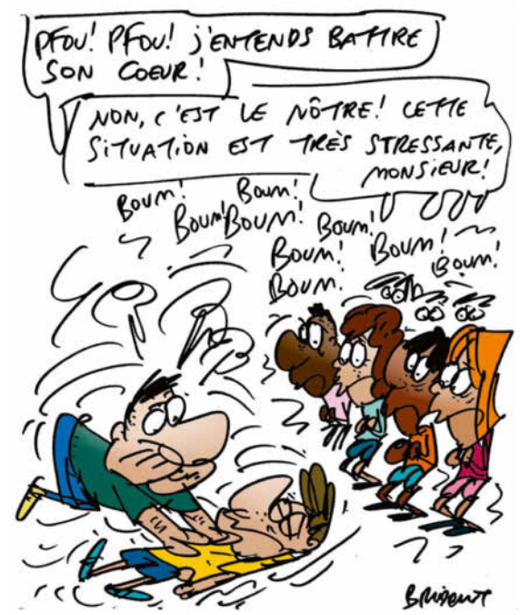
PHOTO DU JOUR