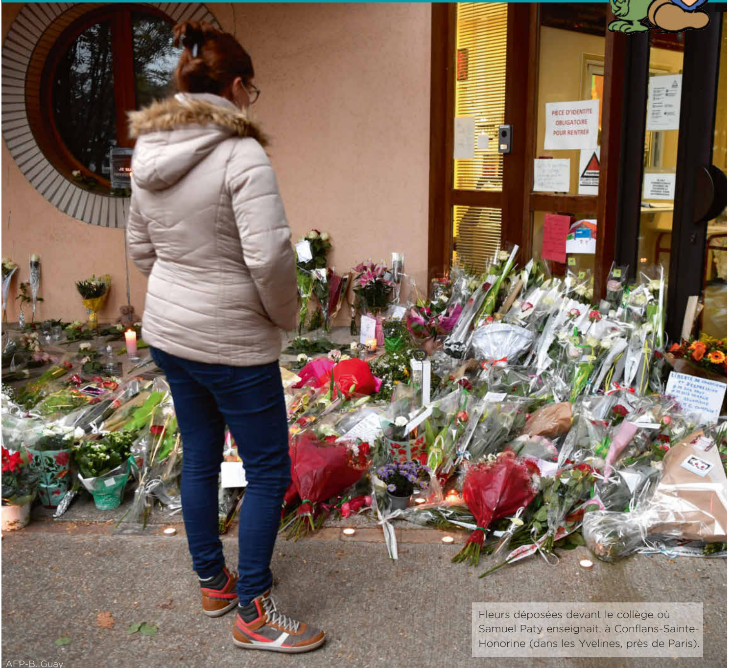
Fleurs déposées devant le collège où Samuel Paty enseignait, à Conflans-Sainte-Honorine (dans les Yvelines, près de Paris).