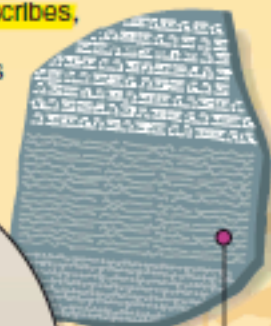
La pierre de Rosette a permis de déchiffrer les hiéroglyphes

Les Égyptiens sont l'un des premiers peuples à avoir utilisé l'écriture, il y a plus de 5 000 ans. Leur écriture se présente sous forme de petits dessins : les hiéroglyphes. Son apprentissage est difficile. Ceux qui maîtrisent l'écriture, les scribes , sont très respectés à l'époque. Les hiéroglyphes ont été déchiffrés à partir de 1821 par un Français : Jean-François Champollion.