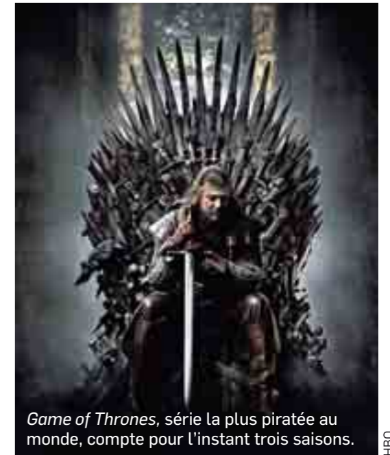
Game of Thrones , série la plus piratée au monde, compte pour l'instant trois saisons.

Elle débarque en clair à la télé française. La première saison de Game of Thrones sera diffusée à partir de lundi sur D8, à raison de deux épisodes chaque lundi à 22 h 45. Adaptée de la série de livres d' heroic fantasy de l'Américain George R. R. Martin ( Le Trône de fer en français), cette série événement est un mélange entre Le Seigneur des anneaux et Le Prince de Machiavel . Au programme : intrigues politiques, rivalités familiales et actions militaires dans le monde magique de Westeros, où des dynasties royales s'échangent pour le pouvoir. Le tout pimenté d'effets spéciaux, d'humour grinçant, de sang et de sexe (la série est déconseillée aux moins de 12 ans).